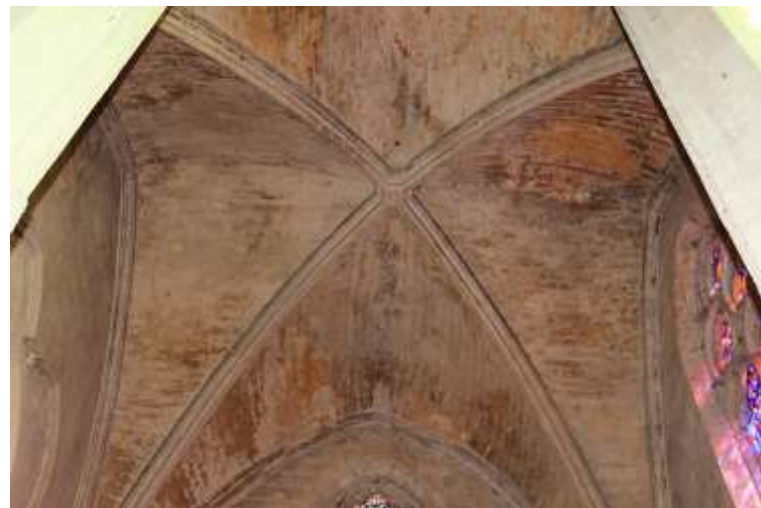
Eglise collégiale de Saint-Emilion – chapelle sud-est