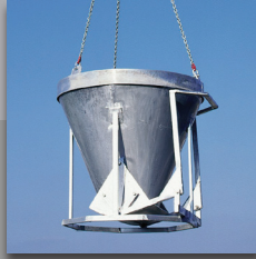
Benne à béton