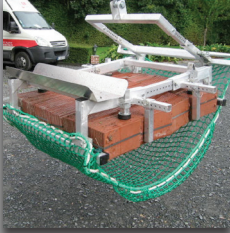
Pince à tuiles