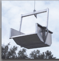
Benne Alu automatique