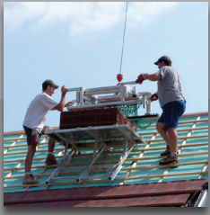
Support de toit