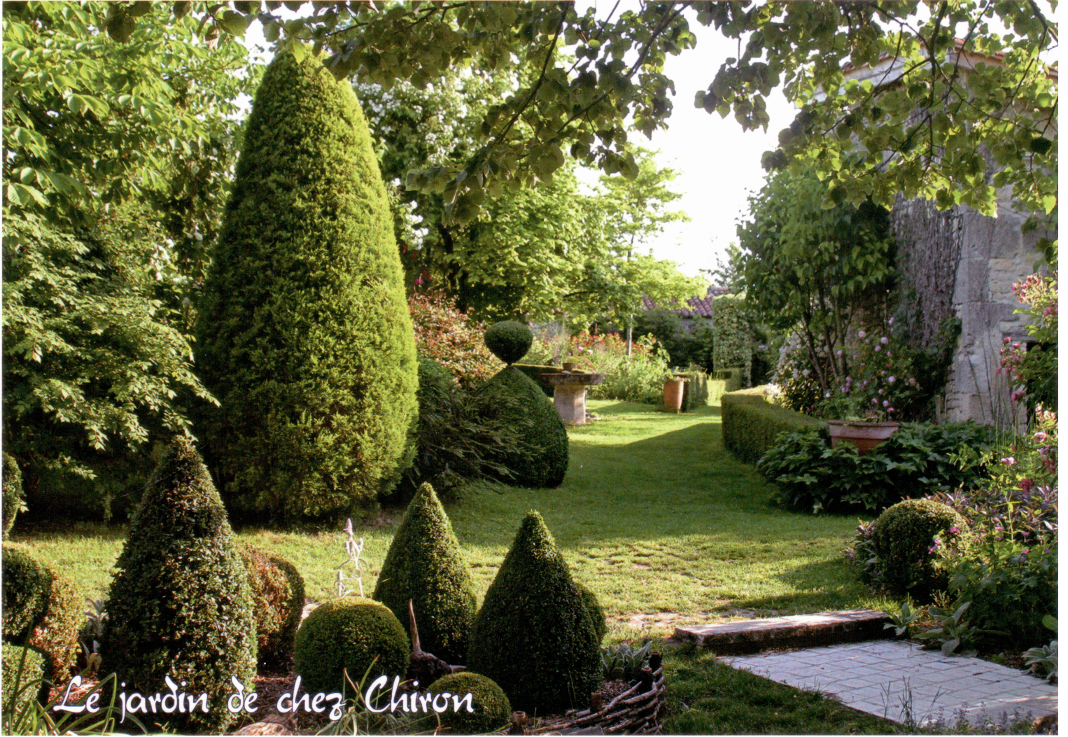
Le jardin de chez Chiron