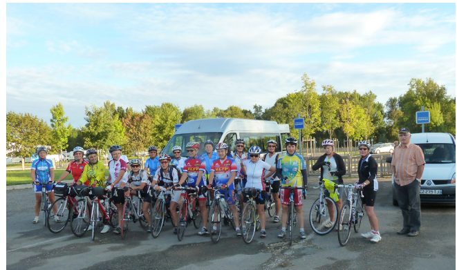
Les 100 kms de découverte